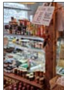
Nuvarande Ost & Vinbar

För några år sedan gjordes en undersökning kring vad Ronnebyborna önskade i sin stadskärna. Högt på listan stod då bl.a. en sportbar och en restaurang med en lite högre klass på sin a la carte meny. Vår ambition är att uppfylla de önskingarna. Vi bestämde oss helt enkelt, vi gör det! Arbete pågår nu för fullt i god dialog och samarbete med Ronneby kommun.