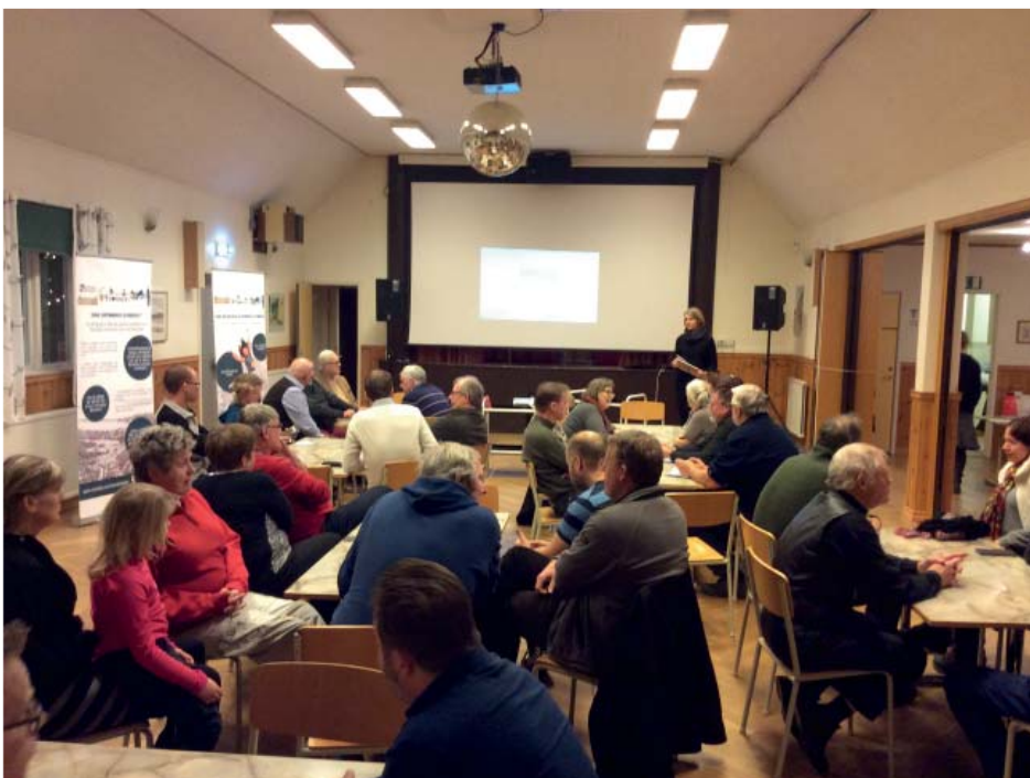
Dialogmöte i Hallabro den nordvästra delen av kommunen diskuterades.