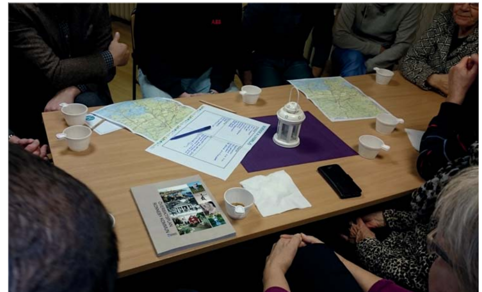
Diskussion om temaområdet "Boende & Livsmiljö" på dialogmötet i Johannishus.

Efter att ett temaområde diskuterats fick vardera grupp presentera det viktigaste som kommit upp i diskussionerna för tjänstemännen, politikerna och de andra grupperna. Alla anteckningsblad samlades in. Mötet avslutades med reflektioner från de närvarande politiker och en vidare diskussion om vad som är viktigt att satsa på i arbetet med översiktsplanen.