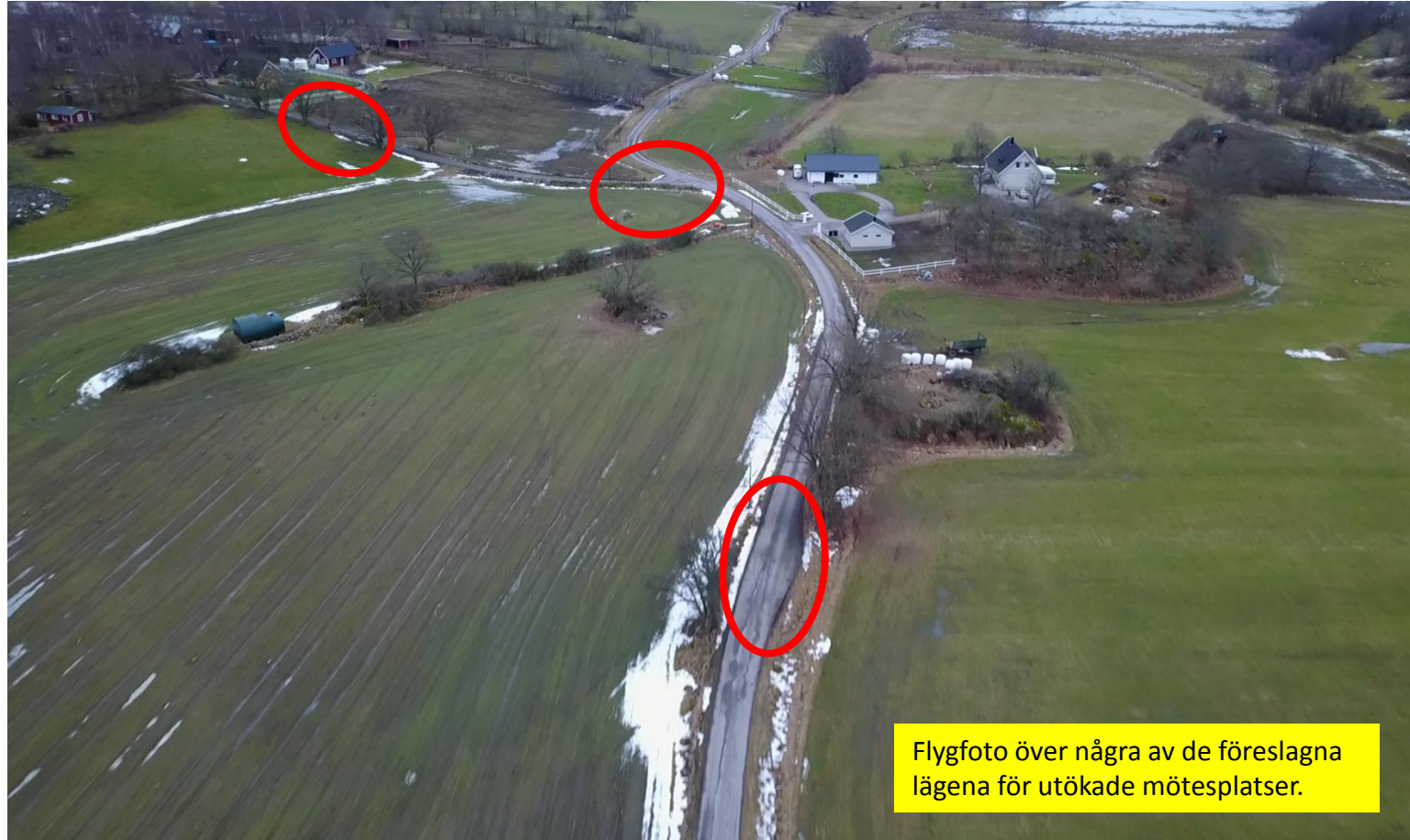
Flygfoto över några av de föreslagna lägena för utökade mötesplatser.