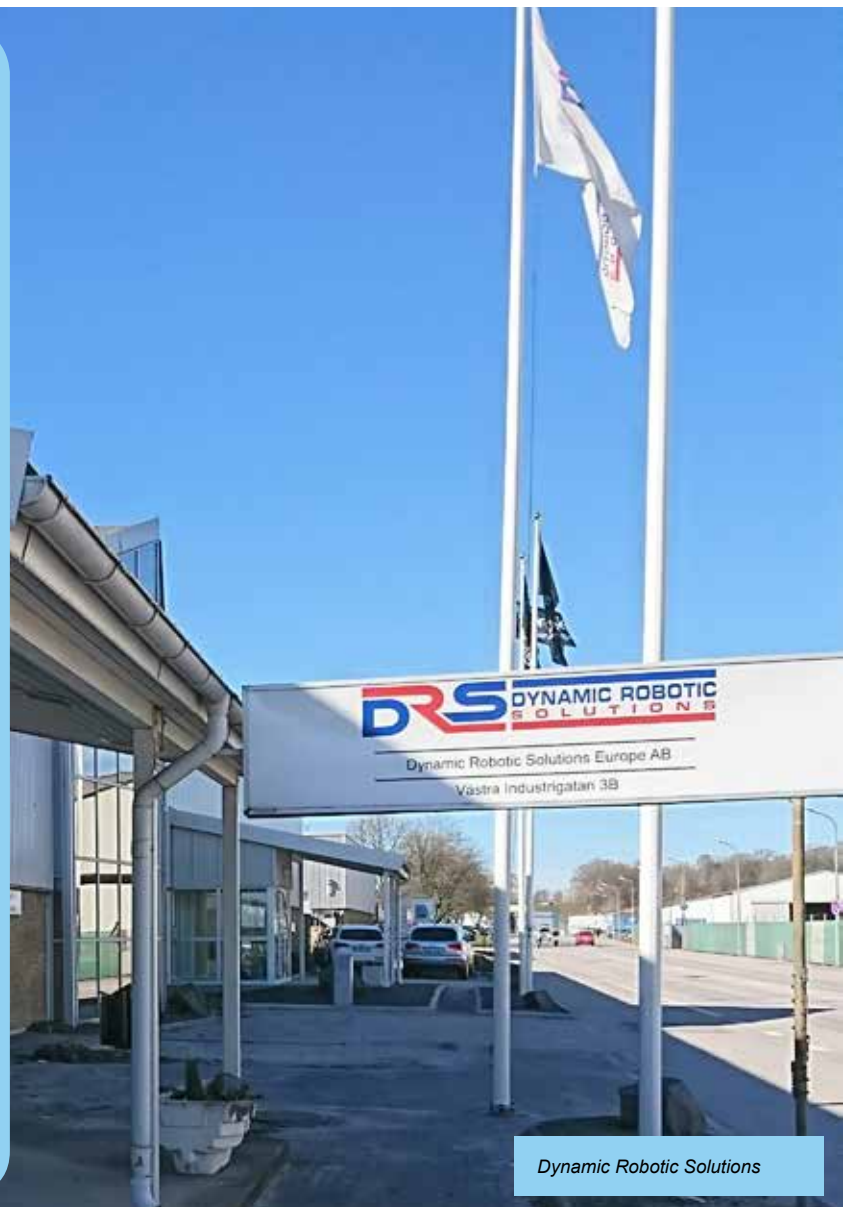
Dynamic Robotic Solutions

Alfa Laval, filial Blekinge flygflottilj, F 17 Dynamic Robotic Solutions Orbit One AB Samhall AB, filial Tarkett AB