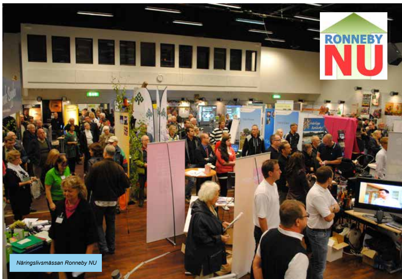
Näringslivsmässan Ronneby NU